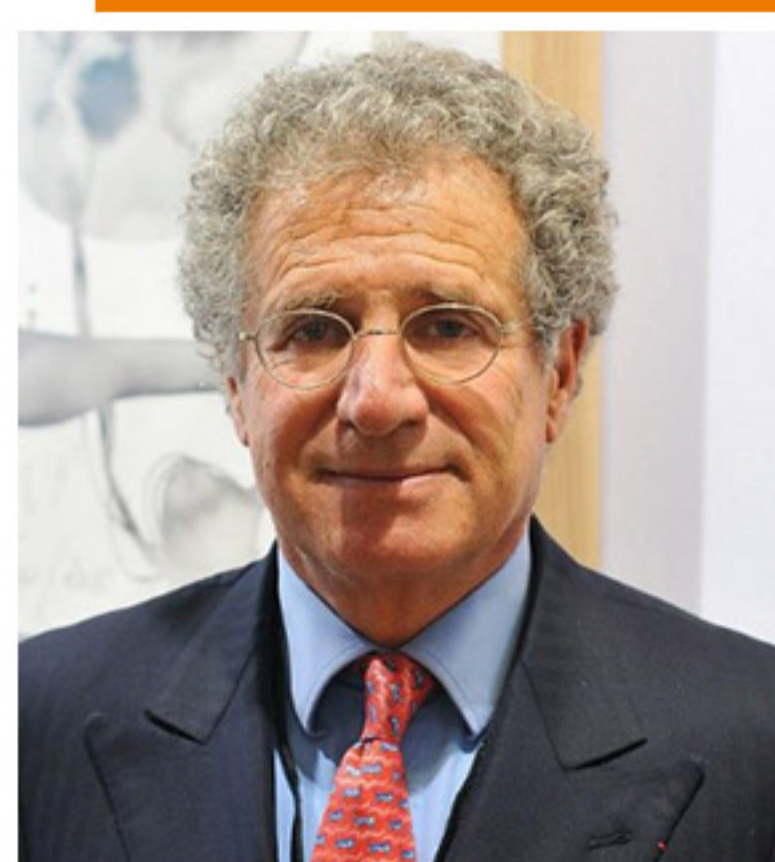
■ Laurent Dassault